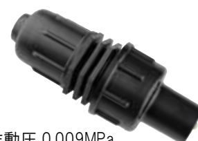
フラッシングエンド