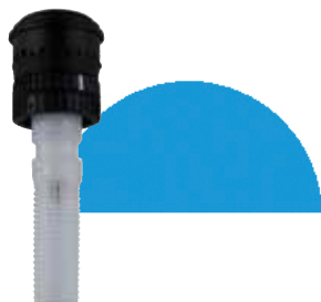
R13-18H 5/8"UNS メスネジ