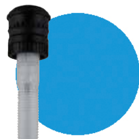
R13-18F 5/8"UNS メスネジ