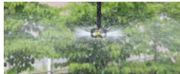
MA-407 性能表（圧力 0.2MPa ノズル高 200cm）