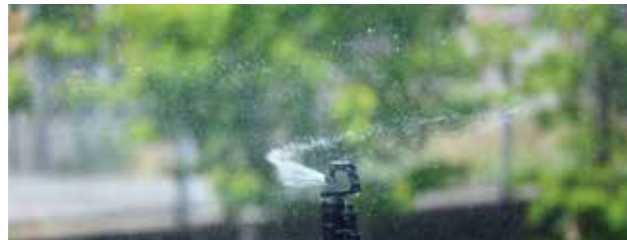
MA-405 性能表（圧力 0.2MPa ノズル高 20cm）