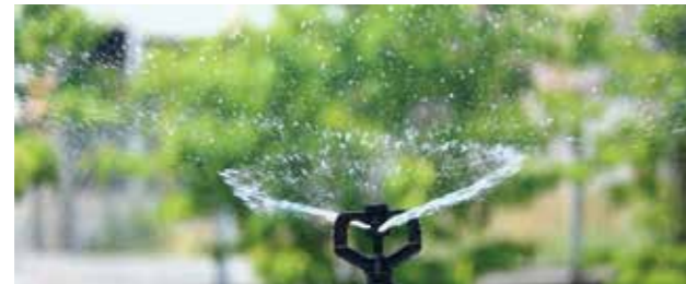
MA-406 性能表（圧力 0.2MPa ノズル高 20cm）