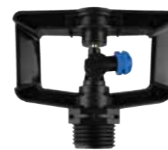
MV-310 1/2" オスネジ（アグリロッドセット、アグリスパイク用）