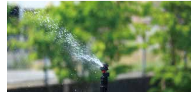
ME-965P 性能表 (圧力 0.2MPa ノズル高 70cm)