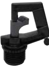
MA-405 1/2" オスネジ（アグリロッドセット、アグリスパイク用）