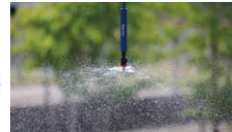
ME-700 性能表（圧力 0.2MPa ノズル高 25cm）