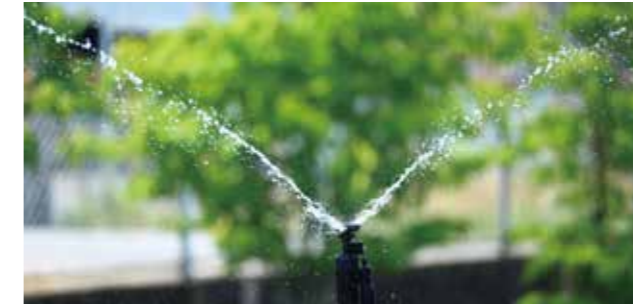
ME-965 性能表 (圧力 0.2MPa ノズル高 70cm)