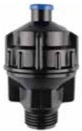
MD-255 1/2" オスネジ (アグリロッドセット、アグリスパイク用)