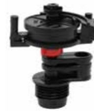
ME-965PA 1/2" オスネジ (アグリロッドセット、アグリスパイク用)