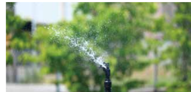
MA-405 性能表 (圧力 0.2MPa ノズル高 60cm)