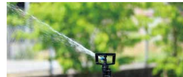
MV-310 性能表（圧力 0.2MPa ノズル高 60cm）