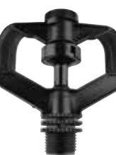
MA-406 1/2" オスネジ（アグリロッドセット、アグリスパイク用）