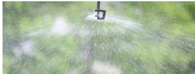
MA-403 性能表（圧力 0.2MPa ノズル高 200cm）