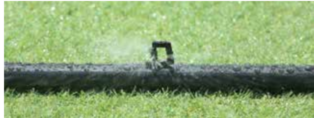
MA-401 性能表（圧力 0.2MPa ノズル高 20cm）