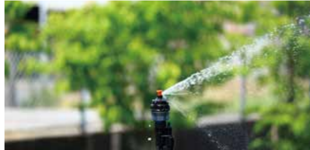
MD-200 性能表 (圧力 0.2MPa ノズル高 60cm)