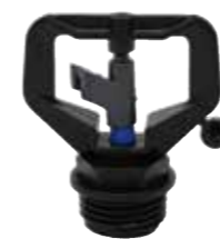
MW-313 1/2" オスネジ（アグリロッドセット、アグリスパイク用）