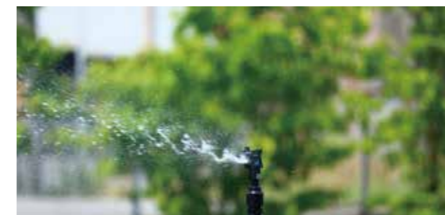
MA-405 性能表 (圧力 0.2MPa ノズル高 60cm)