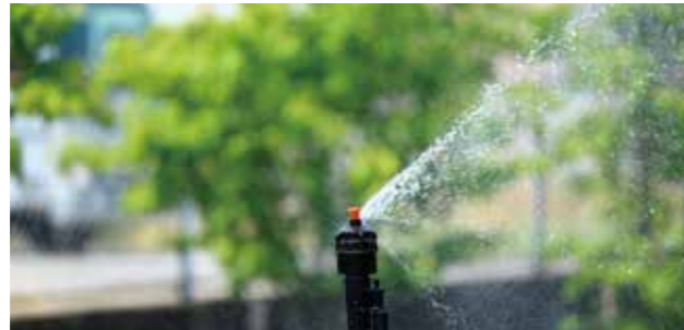
MD-255 性能表 (圧力 0.2MPa ノズル高 60cm)