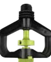
MA-407 1/2" オスネジ（逆吊り用）