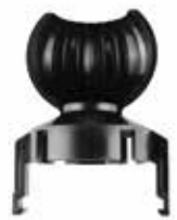
MD-PR ボールスプリンクラー用プロテクター 180° 飛散防止