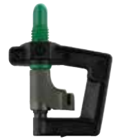
MA-403 ポリエチレンパイプネジ込み用（逆吊り用）