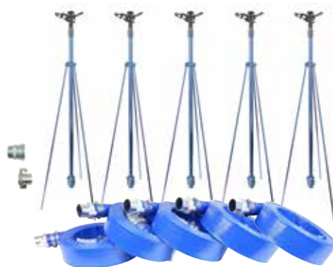
NPH-405 40mm 5本立セット