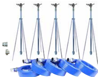
NPH-505 50mm 5本立セット