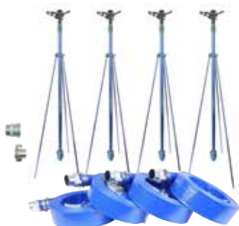
NPH-504 50mm 4本立セット