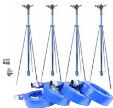
NPH-404 40mm 4本立セット