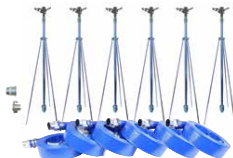
NPH-506 50mm 6本立セット