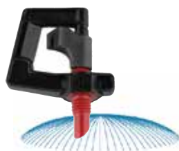
MA-401 性能（ノズル高 20cm）

全面を一斉散水しますので、自然雨と同様なかん水効果があります。飛散力は柔らかく、小雨程度の雨粒が全面を均一にかん水します。