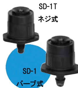
SD-1/1T 性能（22 クリック）