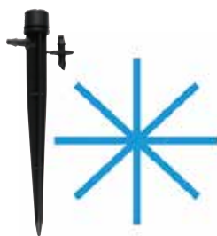
SD-8S-100 性能 (22 クリック)